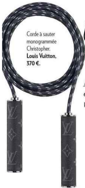
Corde à sauter monogrammée Christopher. Louis Vuitton, 370 €.