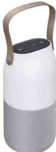
Enceinte nomade, diffusion sonore à 360° et éclairage d'ambiance, charge sans fil. Samsung, 49,99 €