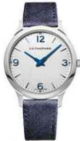
Sport chic. L.U.C. XP, en acier, mouvement automatique. Chopard, 8100 €.