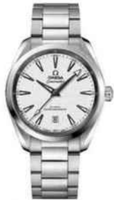
Plongées élégantes. Seamaster Aqua Terra en acier, mouvement automatique. Omega, 5100 €.