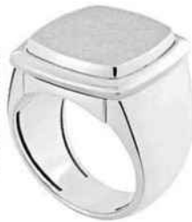
Bague Pain de Sucre Interchangeable en or blanc et plaque chevalière en or blanc satiné. Fred, 4190 €.

PAR TIPHAINÉ MENON, HERVÉ BORNE ET MARTINE COHEN