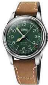
Pilotes vintage. Big Crown D.26 en acier, mouvement automatique. Oris, 1850 €.