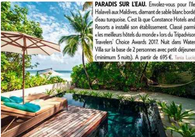
PARADIS SUR L'EAU. Envolez-vous pour l'île Halaveli aux Maldives, diamant de sable blanc bordé d'eau turquoise. C'est là que Constance Hotels and Resorts a installé son établissement. Classé parmi « les meilleurs hôtels du monde » lors du Tripadvisor Travelers' Choice Awards 2017. Nuit dans Water Villa sur la base de 2 personnes avec petit déjeuner (minimum 5 nuits). A partir de 695 €. Tania Lucio