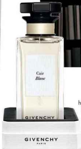
L'Atelier, une ligne haute parfumerie, Cuir Blanc eau de parfum. Givenchy, 195 €.